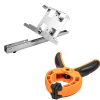
Zestaw do mocowania miernika nasłonecznienia do paneli PV