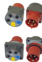
Adapter gniazd trójfazowych 16 A / 32 A