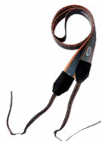
Szelki do miernika (typ M1)