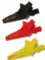
Krokodylek 1 kV 20 A czarny / czerwony / żółty