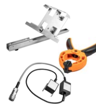
Zestaw do mocowania miernika nasłonecznienia do paneli PV + sonda do pomiaru temperatury paneli PV oraz otoczenia