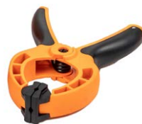
Zacisk do mocowania miernika nasłonecznienia do paneli PV