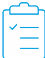
Certyfikat kalibracji - IRM-1